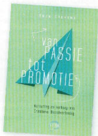
Van passie tot promotie , ISBN 978-90-819193-0-2